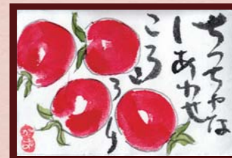
「ちっちゃな幸せころり」 かず様 (神戸店 / 主婦 / 76歳)