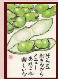
「大好き！そら豆」 キリン様 (エキマルシェ店 / 主婦 / 64歳)

【総評】 ししゃもが刺さった串を 仲良く大合唱している姿 に捉えた、ユニークな感 性が素敵です。