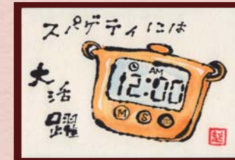
「キッチンタイマー」 M様 (女性 / 51歳)