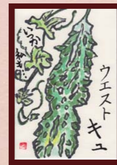
「願い」 木本 由美子様 (主婦 / 64歳)