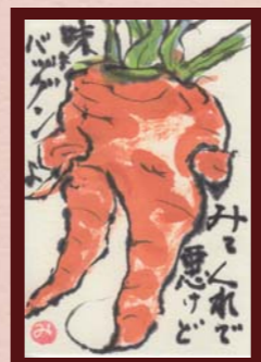
「みたくれで悪けど 味はバグンよ」 M様 (女性 / 82歳)