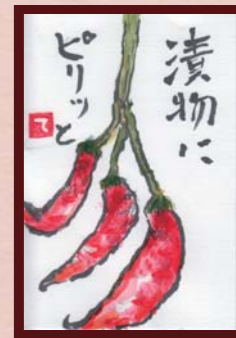
「ピリッと」 主婦 72才様 (エキマルシェ店 / 主婦 / 72歳)