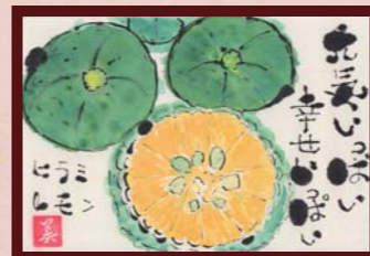
「幸せ」 吳 寧美様 (自営業 / 女性 / 58歳)