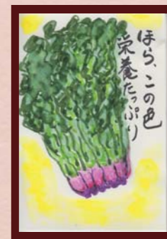
「栄養たっぷり」 露木 恵美子様 (橋本店 / 女性 / 57歳)