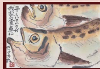
「焼いて食べて満足」 長谷川 カツヨ様 (主婦 / 73歳)