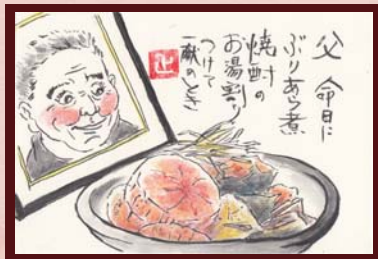
「父 命日にぶりあら煮」 いいのまさ江 様 (調理師 / 女性 / 67歳)