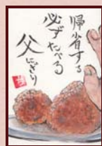
「かわらない味」 ちいさん様 (自営業 / 女性 / 30歳)