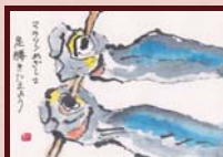
「マラソンめざして足腰きたえよう」 中島 寿子様 (主婦 / 女性 / 75歳)