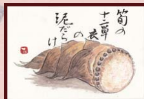
「タケノコ」 翠石 様 (無職 / 男性 / 71歳)