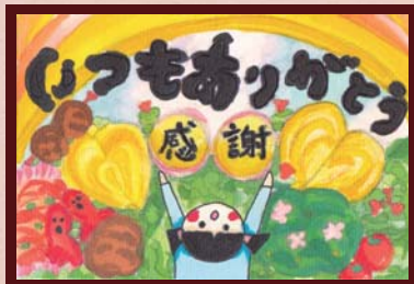
「朝一番のケッコーな卵」 ランランおばさん様 (主婦 / 女性 / 69歳)