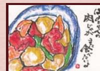
「孫は必ずリクエスト」 西尾 美恵子様 (主婦 / 女性 / 74歳)