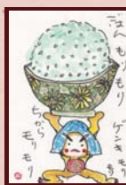
「ごはんモリモリ!!」 T 様 (主婦 / 女性 / 70歳)