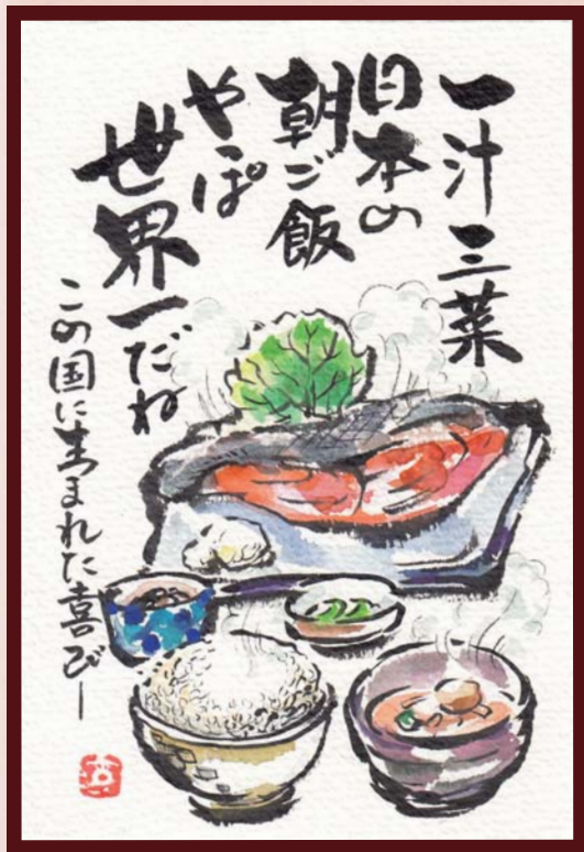
「四季を通じて」 新庄 すが江 様 (自営業 / 女性)

【総評】 臨場感のある素晴らしい絵に一同感激しました。和食がユネスコ世界文化遺産に登録されて早10年、登録理由に「日本人が抱く"自然の尊重"の精神を体現した食に関する社会的慣習」とあります。まさにこの絵手紙の通りですね！