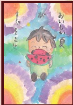
「待ち遠しい夏」 ゆうちゃん様 (小学生 / 女性)