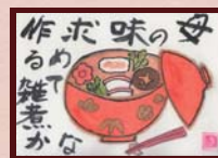
「忘れられない母の雑煮」 なきうさぎ様 (主婦 / 女性 / 70歳)