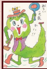
「お〜い 元氣かい」 W 様 (自営業 / 男性 / 81歳)