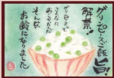
「グリーンPeaceご飯」 きよきよ 様 (主婦 / 女性 / 51歳)