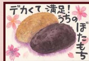
「デカくて満足!うちのぼたもち」 M 様 (会社員 / 女性)