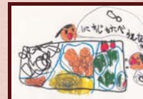
「じぶんだけのおべんとう」 りか子様 (6歳)