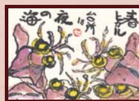
「春を感じる一品」 西岡 節子様 (主婦 / 女性 / 73歳)