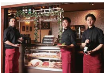
パワーアップして梅田の地にオープン