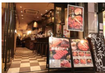
心齋橋筋商店街にあった旧ロマン亭