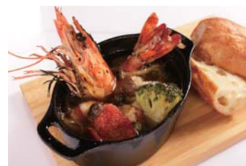
ランチの目玉「ロマン亭ハラミ ひつまぶし」 大きな有頭海老が1匹入ったアヒージョ

店頭ショーケースには塊肉が並び、お客様をお出迎え。名物の完熟肉ステーキはその日食べ頃になったお肉をお好みのサイズと焼き方でご提供します。ランチタイムには気軽にお肉が楽しめる丼や定食をご用意。新メニュー「ひつまぶし」は、お肉とご飯を様々な食べ方で味わっていただけます。ディナーではワインと共に楽しめる肉タパスを多数ご用意。有頭海老を使ったアヒージョなど一風変わった料理もご用意。お近くにお越しの際はぜひお立ち寄りくださいませ。