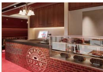
新しい店内の完成予定図