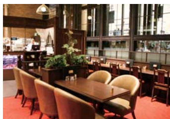
売り場の改装に伴い閉店した旧ロマン亭

素材本来の美味しさを逃さないようお肉の中心までゆっくり火を通し、衣はさっくり、中はしっとりジューシーに仕上げます。旨味を引き出した完熟肉を使用した看板商品「ヘレカツサンド」の他、卵サラダをミルフィーユ状に重ねた名物の「タマゴサンド」、豚ヘレの一番やわらかく美味しい部位であるシャトーブリアンを丸ごと一本丁寧に火を通した高級カツサンドなど、当時と変わらぬ味とサービスをご提供します。お近くにお越しの際はぜひお立ち寄りください。