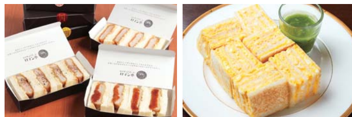
テイクアウトは全5種 電話予約も可能 ミルフィーユ状に重ねた名物「タマゴサンド」

飲食店向けの卸業を営む傍ら「ピフテキ重・肉飯ロマン亭」など、大阪を中心に15店舗を展開する岡山フードサービス。『カツサンドパーラーロマン亭』は、豚肉の美味しさを引き出すサンドウィッチ専門店として2016年夏にオープンしました。売り場の改装にともない閉店しておりましたが、この度あべのハルカス近鉄本店に復活オープン。テイクアウト専用カウンターや、ゆったりとした客席を設け、コロナ禍での需要に対応しました。