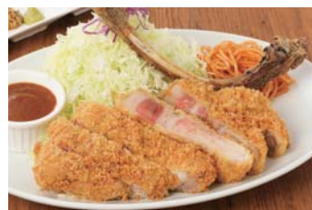
熟成骨付き特上ロースカツ

同日、ロマン亭の隣には洋食とんかつ専門店「とんかつ さくら亭」もオープンします。肉卸としてのノウハウと想いを込め、カットや揚げ方に工夫を凝らしたとんかつをご提供。ブランド豚「薩摩茶美豚」の肉汁をたっぷり閉じ込めた名物「潤トンカツ」や、骨ごと約10日間熟成させたリブロースを厚切りで味わえる「特上ロースカツ」など豊富に取り揃えます。ロマン亭と合わせて、ぜひお見知りおきください。