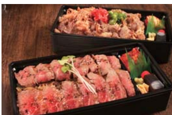
新しくなった「肉重弁当」

生産～流通～販売という『食の六次化』を手掛ける岡山フードサービス(株)の外食事業メインブランド「ビフテキ重・肉飯 ロマン亭」。施設の改装にともなう一時閉店から、今回新たに席数を増やし、より一層パワーアップしてリニューアルオープンします。落ち着いた和の空間で、「一膳の口福(ほんの少しの幸せ)」を感じていただけるお店を目指します。