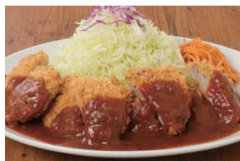
さくら亭名物「潤トンカツ」

また、お家での食事需要の高まりにお応えすべく、精肉とテイクアウトの販売スペースを設けました。精肉コーナーではご家庭で気軽にお使いいただける牛肉や豚肉を厳選してご用意。テイクアウトコーナーでは、お肉たっぷりの肉重弁当や肉惣菜を販売、自宅や外出先でもロマン亭の味をお楽しみいただけます。