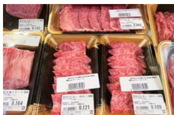
ご家庭用の精肉販売も

また、お家での食事需要の高まりにお応えすべく、精肉とテイクアウトの販売スペースを設けました。精肉コーナーではご家庭で気軽にお使いいただける牛肉や豚肉を厳選してご用意。テイクアウトコーナーでは、お肉たっぷりの肉重弁当や肉惣菜を販売、自宅や外出先でもロマン亭の味をお楽しみいただけます。