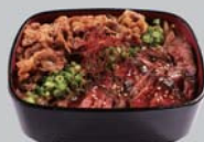
ハラミ&カルビ重 1,230円