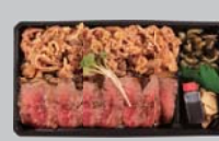
ビフテキ&カルビ弁当 1,030円