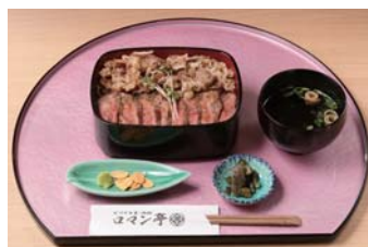
当店名物「ロマン亭錦重」

松原市にオープンする大型商業施設「セブンパーク天美」。その1Fに位置する、ノスタルジックとモダンさ溢れる食物販ゾーン「ニューまったら横丁」に出店します。フードコートスタイルの店内では、名物のロマン亭錦重をはじめとする全10種類のお重をご用意。また、地元の食卓に密着したテイクアウトメニューは、人気の肉重弁当のほかに、から揚げやコロッケなどの肉惣菜を、揚げる前の状態でショーケースに並べ、ご注文いただいてから揚げたてをご用意します。