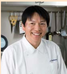
株式会社キッチンエヌ 代表取締役