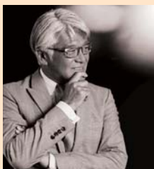
株式会社 バルニバービ 代表取締役会長 CEO 兼 CCO