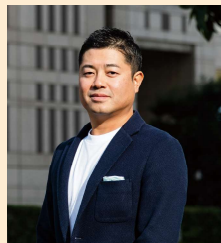
株式会社 ナカセ 代表取締役